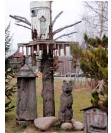
Mesinduse ajaloonurk Dudutki vabaõhukeskuses

Konverentsi järel toimus vestlusring, millel osalesid lisaks Valgevene ja Eesti esindajaile veel külalised Leedust, Poolast, Ukrainast ja Venemaalt. Valetati mesindusinfot ja arutati edasise koostöö plaane. Tutvustamaks meile Valgevene eripära, külastasime Dudutki vabaõhu-puhkekeskust, kus erinevate ekspositsioo-