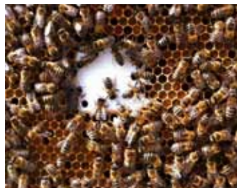
Andur keset suiraraami

Teine andur pesakorpuse serva suiraraami, kolmas pesakorpuse peal asuva meekorpuse keskele ja neljas andur välistemperatuuri mõõtmiseks taru katuseservale.