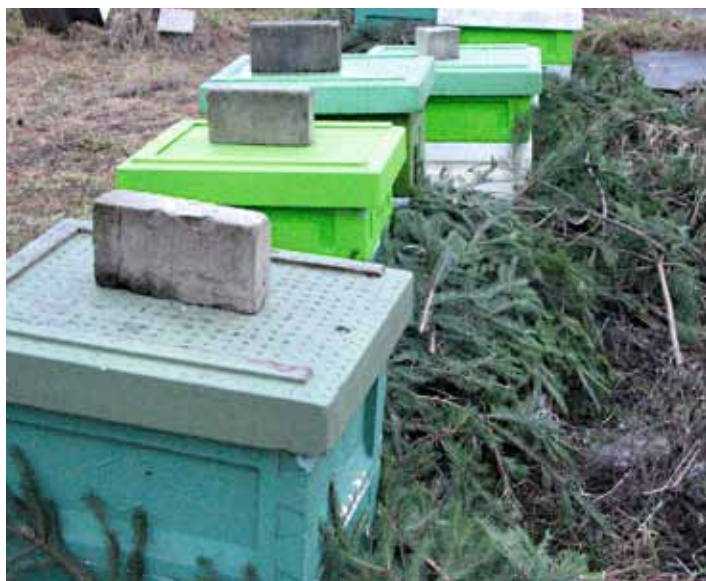
Kuuseokstega kaitstud tarud.

Miks me teda talvel mesilas kohtame? Vastus on tema toidumenüüs. Rasvatihane on segatoiduline lind. Seejuures on taimne materjal oluliselt energiaesem kui rasvarikkad putukad või nende arengujärgud. Rasvatihase toiduvalik sõltub aastaajast: suvel on selles selgrootud ehk peamiselt putukad, talvel rohkem taimne materjal (seemned, marjad). Kevadest sügiseni on tihane aedniku, metsa- ja põllumehe jaoks enamjaolt ääretult kasulik lind, sest hävitab kahjurputukaid. Pesitsusperioodil toidab tihane poegadele ööpäevas vähemalt 50 grammi putukaid ja võib päevas koguda toiduks kuni 400 putukat või tõuku.