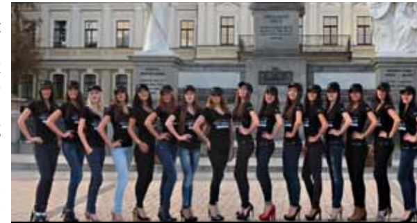
Ukraina missikaandidaadid, kes panid kohalikel miilitsionäridel silmad säräma. Ja mitte ainult neil...

Kui kõhunahk hakkab juba selgroo külge kinni jääma, on tagumine aeg mõelda lõunasöögi peale. Lähikonnas paistavad vaid elumajad, seega tuleb teha määramata pikusega jalgsimatku või otsustada mõne transpordivahendi kasuks. Mõningase arutelu järel langeb liisk taksole. Tänavaservas seisva null-nelja juht soostub meid 30 grivna eest paar kilomeetrit eemal asuva suure kaubanduskeskuse juurde sõidutama, kinnitades ühtlasi, et seal lähedal saab ka süüa. Me tõesti ei viitsi enam jala käia, seega pressime end nõukogude autotööstuse imesse ja mõne minuti pärast pannakse meid „Kassi pitsa“ nime kandva söögikoha ees maha. Pitsabaariga ei olnud me küll arvestanud, lootsime midagi restoranitoolist, aga nälg pidavat üsna hea kokk olema. Astume sisse avarasse ruumi, millele vahelae ehitamisega ei ole vaeva nähtud. Kõrgustes ripuvad ventilatsioonitorud ja kaablipundid, õnneks julgustavalt korralikult kinnitatud, seega istume laua taha. Kohe ilmub ettekandja, kellele me vaheldumisi vene ja inglise keelt rääkides, vahel ka žestikuleerides selgeks teeme, kes me oleme, kust tuleme ja mida tahame. Köök töötab kiiresti ning juba mõne minuti möödudes tuakse esimesed isuäratavalt lõhnavad taldrikutäied. Süües kasvab isu, seega tellime aeg-ajalt mõne meile erilise tunduva roa juurdegi. Kui