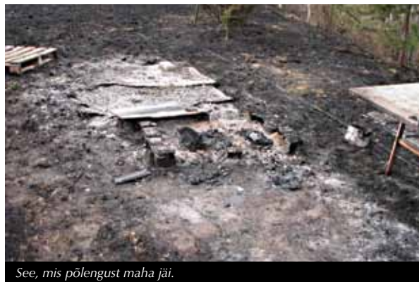
See, mis põlengust maha jäi.

Põleng oli ilmselgelt väga tugev, sest paarist läheduses olnud autorehivist olid järel ainult traadid. Imekombel oli viis peret suurest tulest puutumata jäänud. Ilmselt päästsid tarude ees maas olnud suured