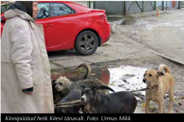
Kinnipüütud hetk Kiievi tänavalt.

Vähemalt täna hommikul saab kauem magada, ja öiseid seiklusi arvesse võttes kulub see nii mõnelegi marjaks ära. Kohtume pärast kella kaheksat hommikusöögilaas, kus vahetame mõõdunud öö muljeid. Need on rikkalikud ega vaja siinkohal