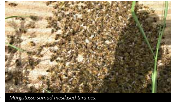
Mürgistusse surnud mesilased taru ees.

Täitsime hulga pabereid ja kogusime taruesiselt surnud mesilasi analüüsiks. Paralleelproov jäi minu sügavkülmikusse, seda hilisemateks vajadusteks. Kahjuks ei taibanud ma koguda eraldi prooviks õietolmuga mesilasi, et hiljem