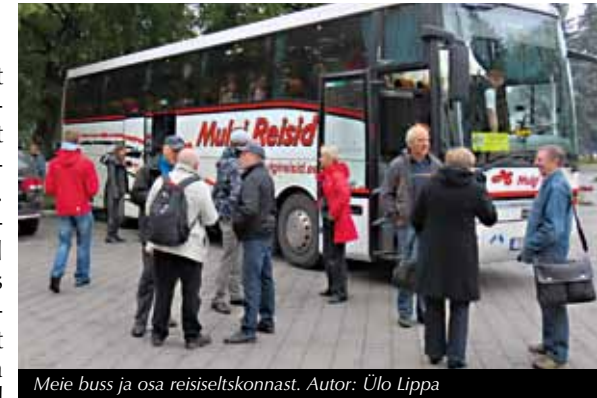
Meie buss ja osa reisieltskonnast.