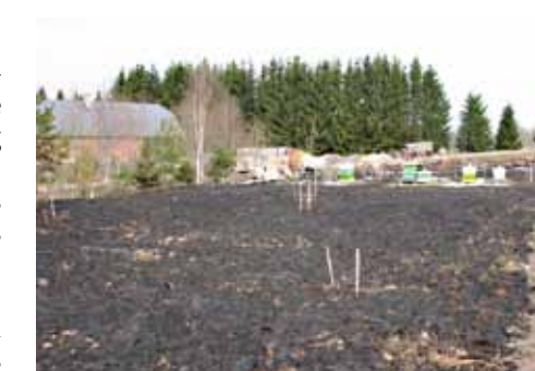
Naabri alepõllundus autori mesilas.

suutis, ise ta ju pelgab mesilasi? Sain veel natuke lähemale ja siis mõistsin, et ei mingit tänapäevast maaharimist. Ikka alepõllundus. Vähemalt pool hektarit oli põlengu ohvriks langenud. Aga minul oli seal seitse tugevat mesilasperet! Kusjuures eelmise aasta keskmine saak kodugrupis oli ikka väga kõrge,