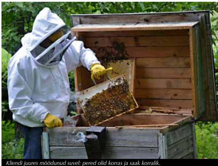
Kliendi juures mõeldud suvel: pered olid korras ja saak korralik.

lik mesinik helistas ning omad mesilased jäid sel korral vaatamata. Pole hullu, ega minu kui mesiniku esmane ülesanne ei ole vigade parandust teha, vaid ikka neid välistada... Vähemalt teatud võimalustel, ja seda teiste mesinike mesilates.