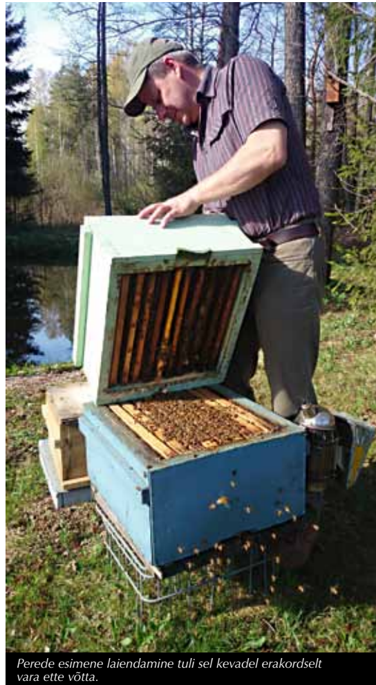
Perede esimene laiendamine tuli sel kevadel erakordselt vara ette võtta.

sel hulgal läheb meil talvituma noori mesilasi ja kui korralik on mesilaspere kevadine elujõulisus. Kui me oleme läinud ühekordse vurrutamise peale, mis toimub augusti lõpus, ja