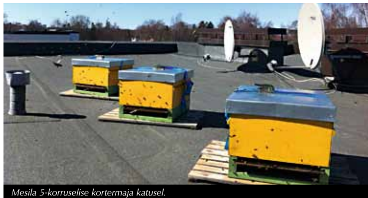
Mesila 5-korruselise kortermaja katusel.

Mesilased on aastaid ennastalvava usinusega olnud keskkonnasaastatuse indikaatori rollis. Seal, kus surevad nemad, pole ka inimesel hea elada. Täna elame olukorras, kus ei möödu päevagi, kui me ei muretsuks mesilaste heaolu ja mee kvaliteedi üle kestvas kempluses maapiirkonnas kasutatavate taimekaitsemürkide vastu. Seetõttu otsustasin maandada riski omamoodi.