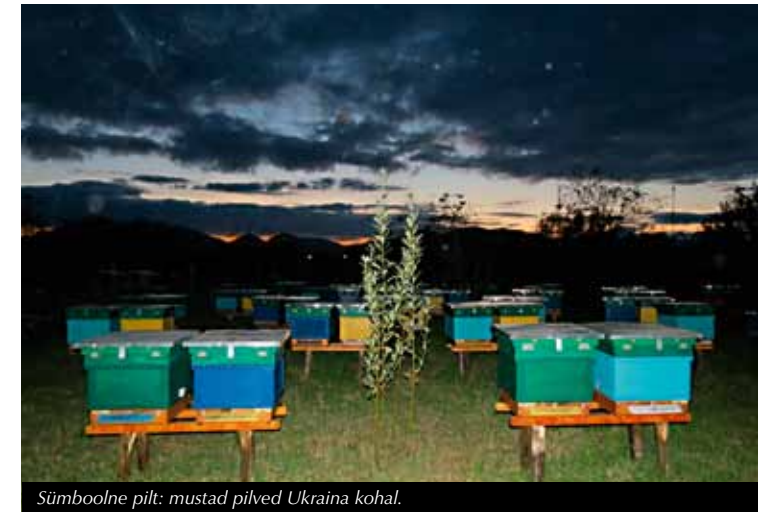
Sümboolne pilt: mustad pilved Ukraina kohal.