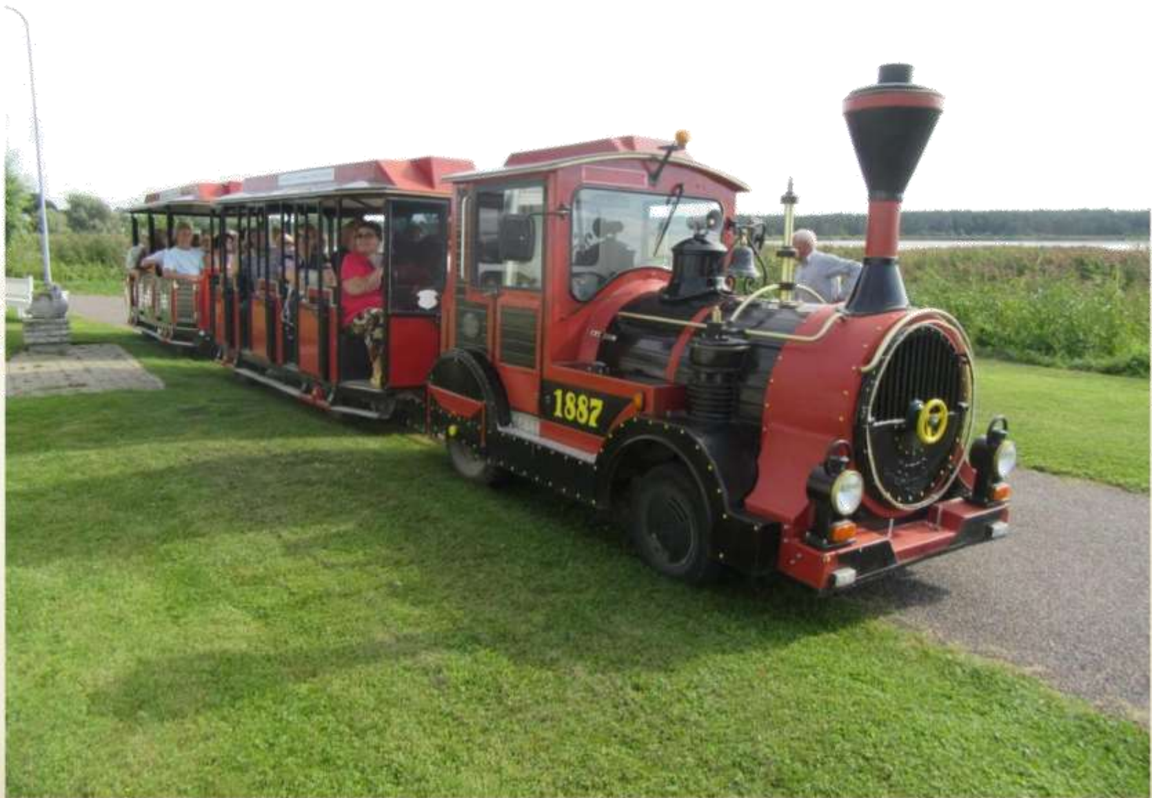
EML suvepäevalised läksid Haapsaluga tutvuma rongiga